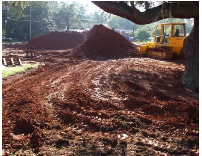
Una gran cantidad de daño pueda ha hecho si los arboles no están protegidos.