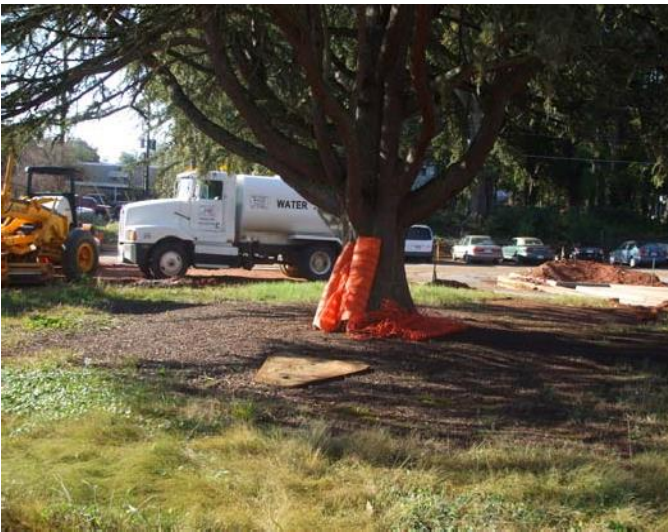
Daño está posible si la barrera no esté armada bien antes de la construcción.