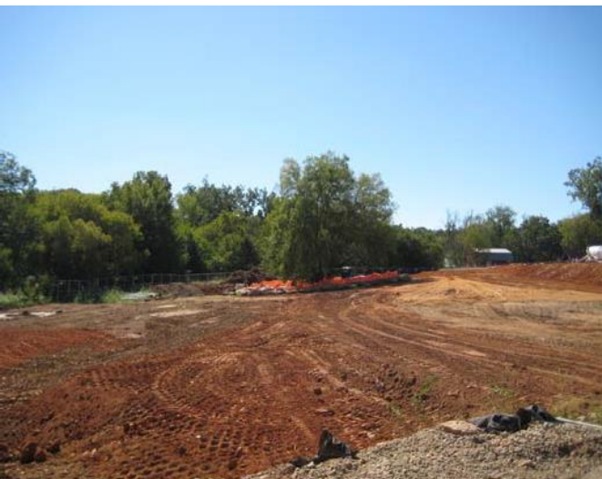
Mientras que no es un requisito, las pierdas que acercan este árbol asegurar que la CRZ está protegida.