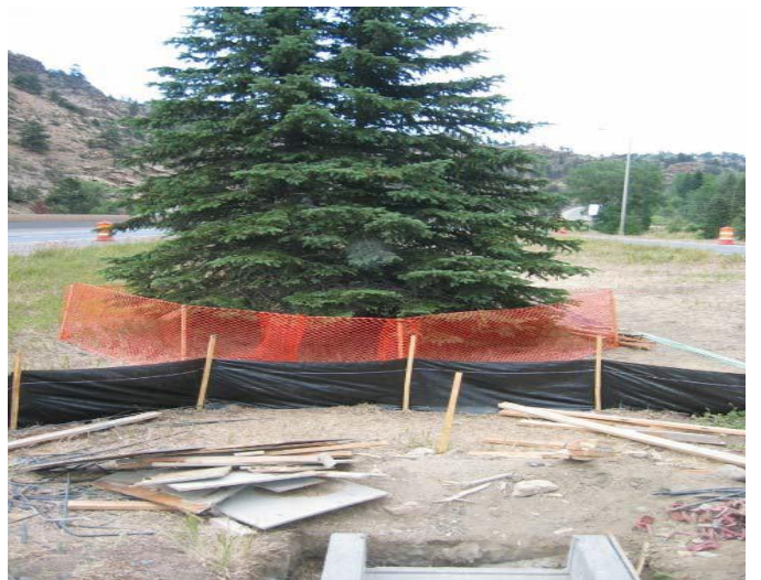
Esta barrera protege suficiente raíces para asegurar que el árbol va a sobrevivir.